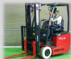
フォークリフト有り!