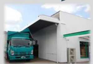
トラックの横付け可!