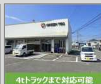
4tトラックまで対応可能