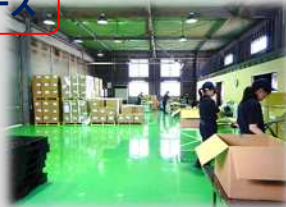
ホコリのたちにくい床