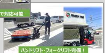
ハンドリフト・フォークリフト完備!